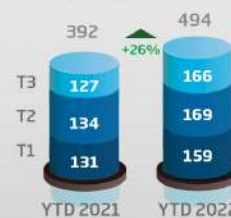
Chiffre d'affaires (consolidé, en MDh)