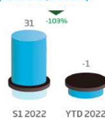
Endettement financier net (consolidé, en MDh)**