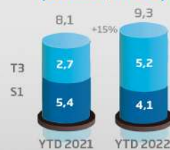
Investissements (consolidé, en MDh)