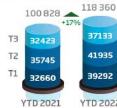
Activité en volume (consolidé, en nbre de dossiers)