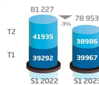
Activité en volume (consolidé, en nbre de dossiers)