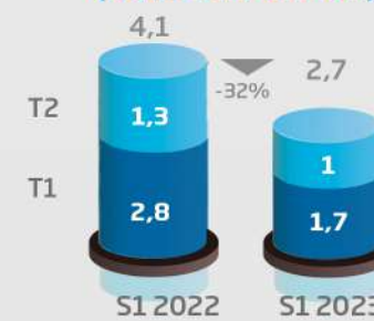
Investissements (consolidé, en MDh)