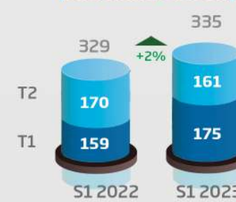
Chiffre d'affaires (consolidé, en MDh)