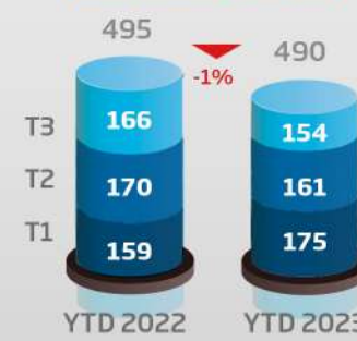
Chiffre d'affaires (consolidé, en MDh)