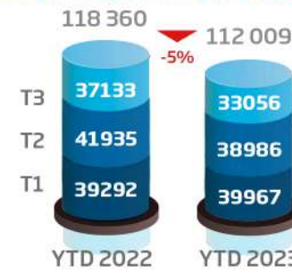
Activité en volume (consolidé, en nbre de dossiers)