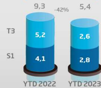
Investissements (consolidé, en MDh)